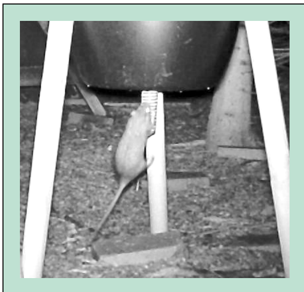
Tid til at prøve en anden metode?

Som et led i bekæmpelsen oprettes ofte baitpladser (lokkefoderpladser), hvor der opsættes et vildtkamera, som kan være med til at afsløre tilstedeværelsen af mårhund. Baitpladsen etableres hvor mårhundene naturligt færdes; gode steder er nær vådområder eller langs vandløb, hvor der er buske, tagrør el.lign. Det kan også være i skov, hvor der findes veksler, eventuelt hvor flere veksler mødes, ved diger hvor der er overkørsler eller ved skovbryn. Baitpladsen placeres gerne i nærheden af buske eller anden tæt vegetation. Det er vigtigt at baitpladsen ikke løber tør for bait, men vær opmærksom på, at der ikke skal ske en egentlig fodring af mårhunden. Det giver bare flere hvalpe næste år! Overvej hvilken type bait, der anvendes. Tiltrækker pladsen rotter, bør der skiftes til en anden type bait. 8