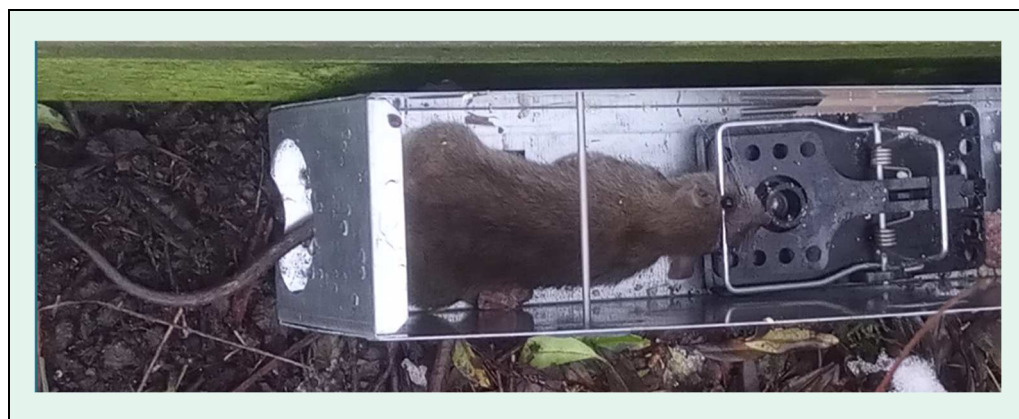
Rotter skal forebygges og bekæmpes effektivt